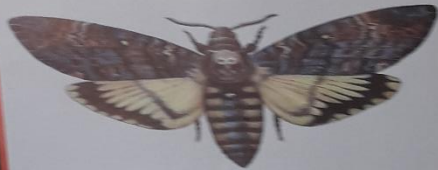
• Блідоник мертва голова