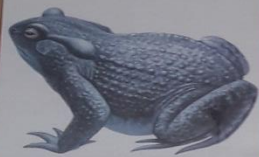
• Жаба сіра